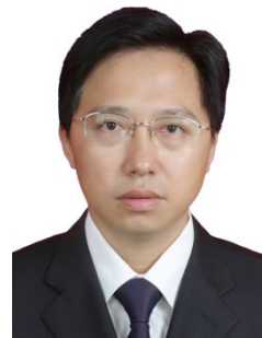
优秀科学家示范岗——何光华 教授